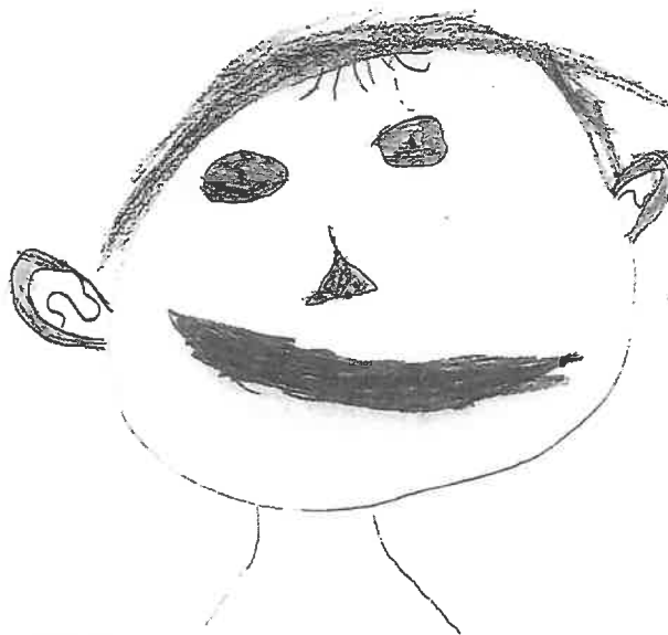
Akzeptiertes Selbstporträt des sechsjährigen Mädchens

Der Vertretungslehrer, der die Klasse während der Elternzeit übernahm, kehrte als Erstes zum Frontalunterricht zurück. Als die Elternzeit beinahe vorüber war, luden die Eltern der Klasse zu einem Elternstammtisch ein. Als dort jemand behauptete,