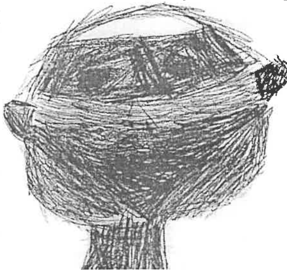
Abgelehntes Selbstporträt eines sechsjährigen Mädchens